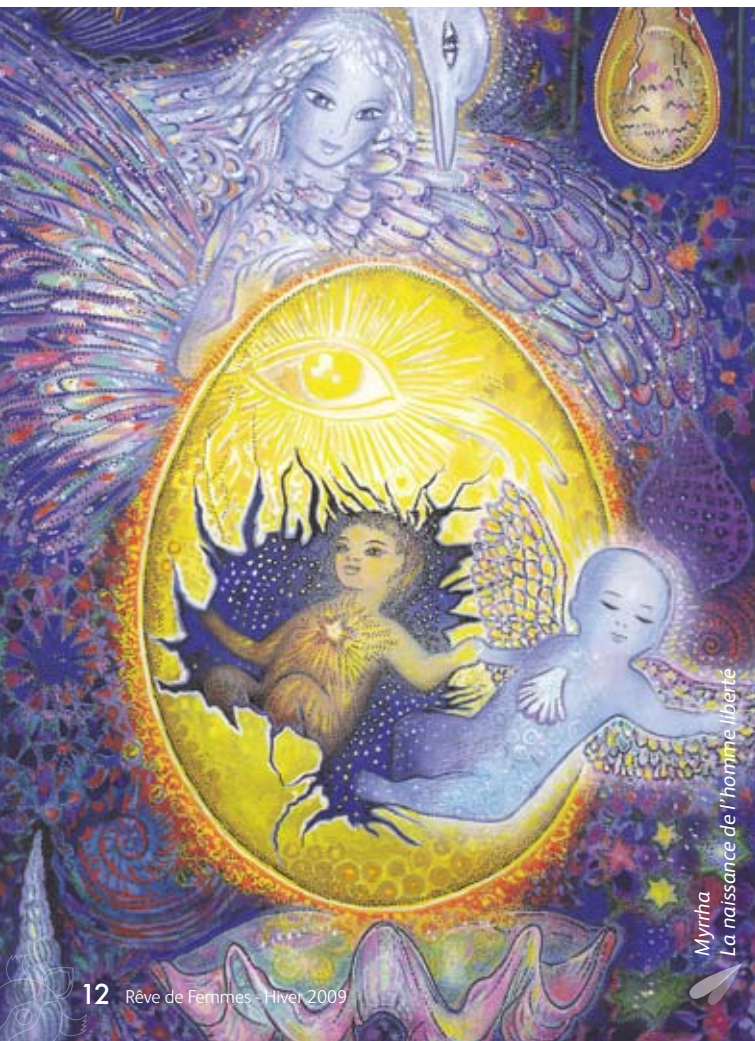
Myrrha La naissance de l'homme libéré

La méthode sympto-thermique est applicable à toutes les femmes et à tout âge de la vie. Pour l'adolescente qui souhaite découvrir l'évolution de ses cycles qui deviendront progressivement ovulatoires, mais non comme moyen de contraception, par manque de maturité et en raison de la montée hormonale fulgurante et difficilement contrôlable. Pour les femmes qui ne souhaitent pas avoir recours aux hormones synthétiques ou aux autres moyens de contraception usuels. Pour les femmes en pré-ménopause en observant la diminution naturelle des signes de fertilité et les modifications physiologiques de leur cycle. On peut appliquer la méthode sympto-thermique que l'on ait des cycles réguliers ou irréguliers étant donné que l'on est dans l'observation et l'interprétation quotidienne et non pas dans la supposition. « Aujourd'hui je suis fertile ou aujourd'hui je ne suis pas fertile ». C'est aussi une belle approche pour les couples en désir d'enfant, afin d'optimiser leur chance de conception, lorsque bébé tarde à venir.